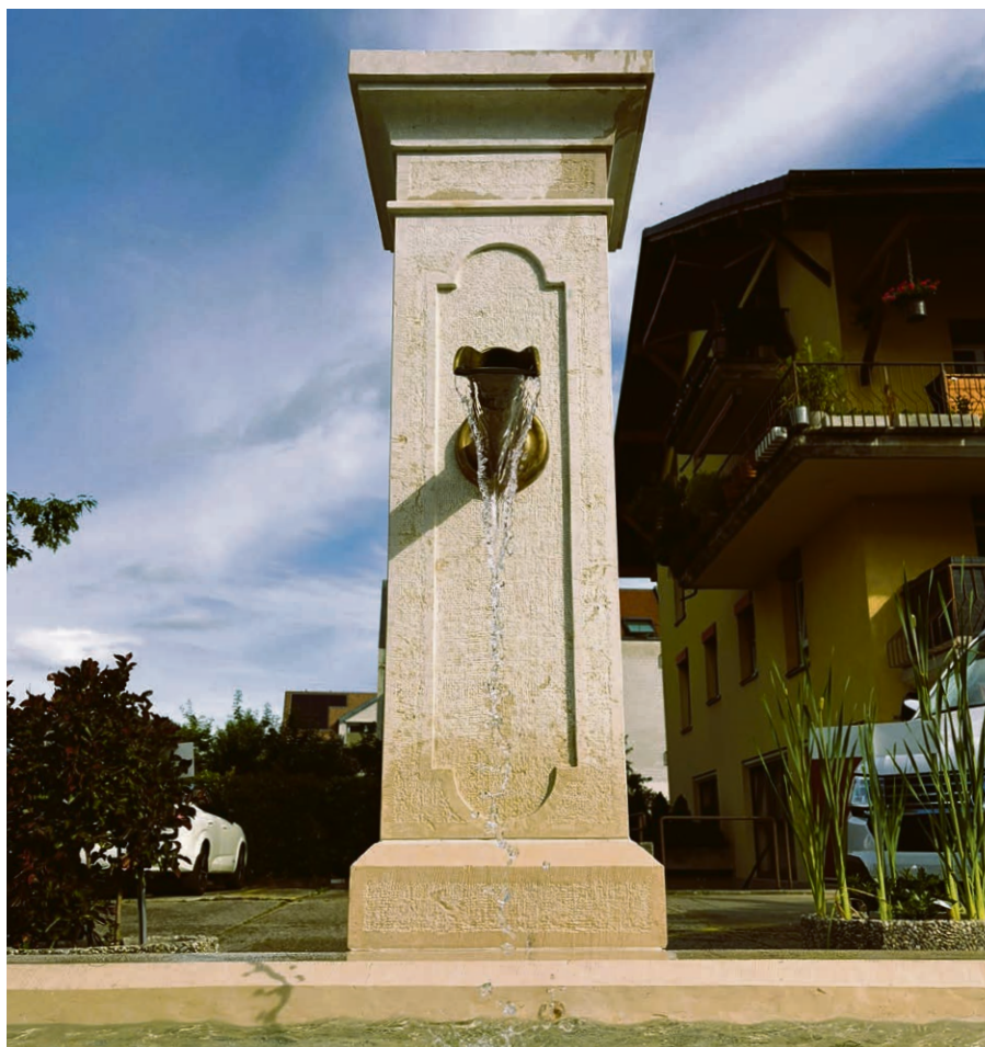
« Vous tous qui avez soif, venez aux eaux. »