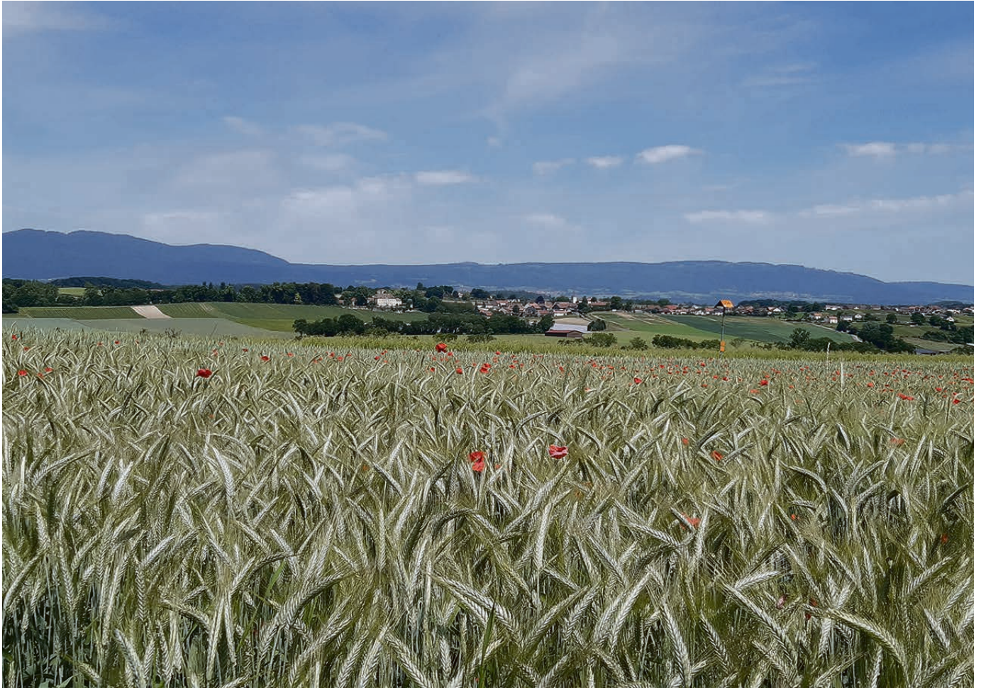
Drussen weht der Sommerwind.

anspruchten. Können Sie sich vorstellen, welche Gefühle da in ihm hochkamen? Er hat sie uns mit keinen schönen Worten beschrieben.