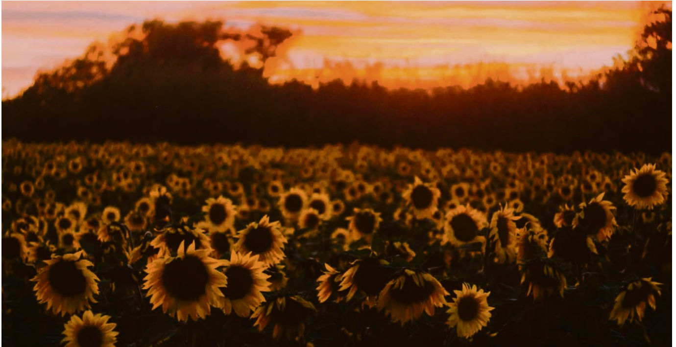
Comme les tournesols en été, j'essaie de regarder vers la lumière (Annika).