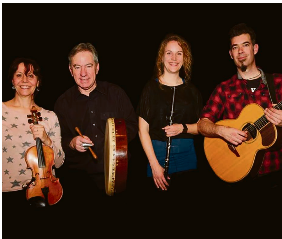
Le groupe de musique traditionnelle irlandaise Doolin.

Prières pendant l'été, les mercredis, de 7h à 8h, et le jeudi, de 19h30 à 21h , à la salle de paroisse.