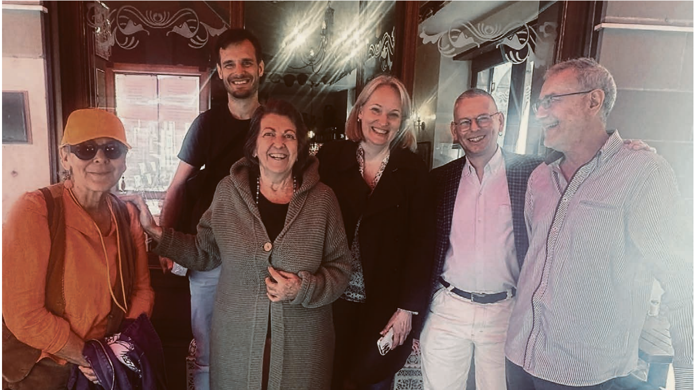
Un repas sous le signe du partage et de la fraternité.