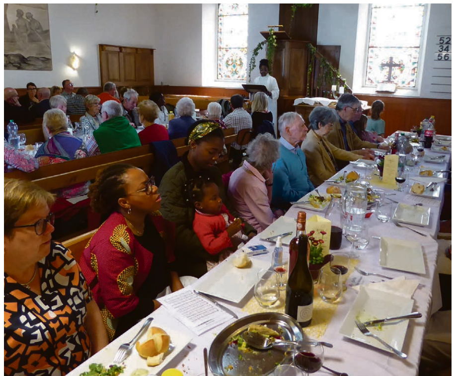
Délices bibliques.