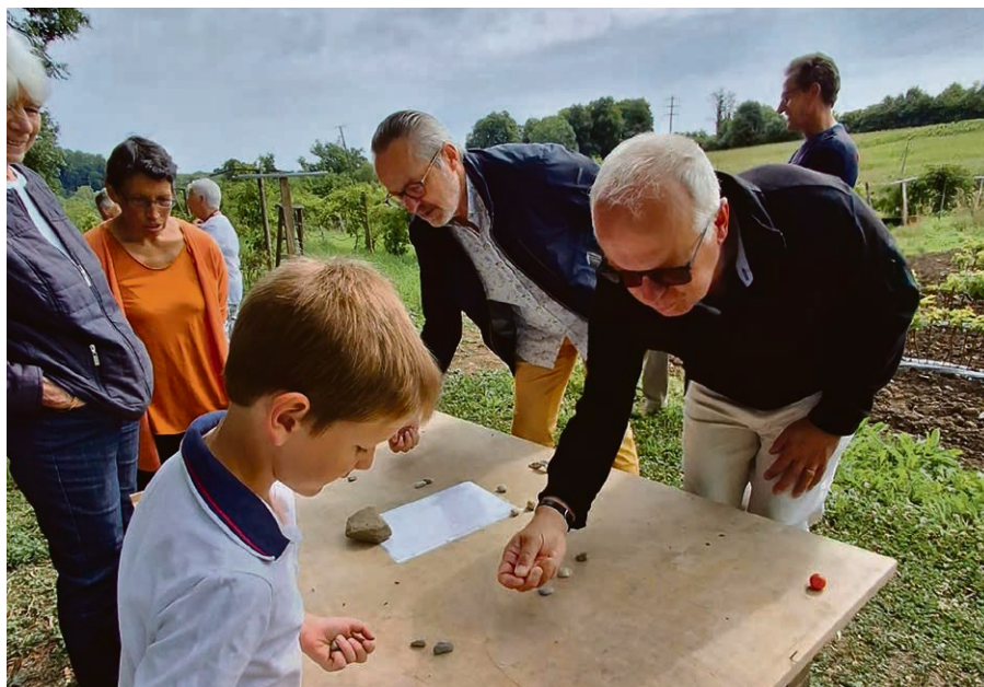
Pied du Jura: animations lors du culte interparoissial avec Saint-Prex - Lussy - Vufflens à Chigny (ici en 2025).