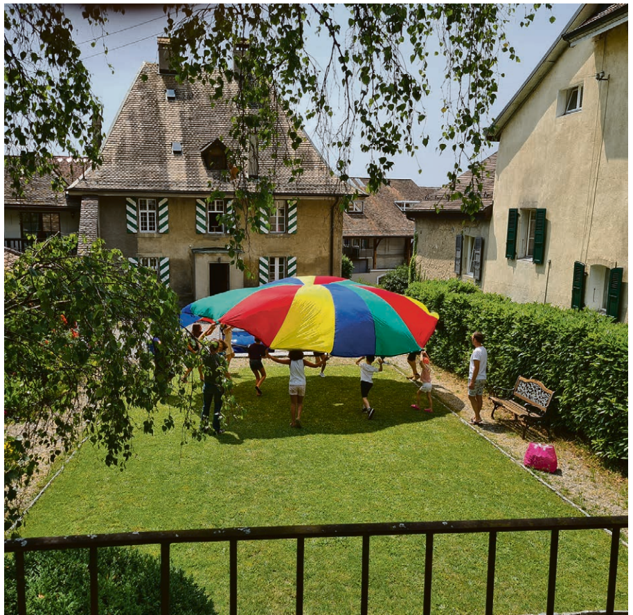
Invitation au jardin de la cure d'Etoy à l'issue du culte.

Le dimanche 5 juillet, à partir de 9h , les paroisses du Cœur de la Côte, Gland, Begnins-Burtigny et Gimel-Longirod vous proposent de vivre un culte en plusieurs étapes. Vous pouvez venir à l'un ou à l'autre des moments, ou participer à l'entier de la journée selon vos envies et votre disponibilité. Programme: 9h : église