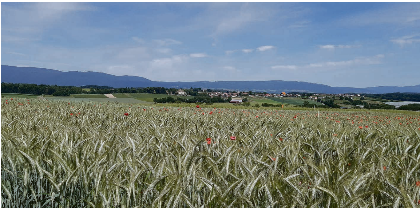
Draussen weht der Sommerwind.