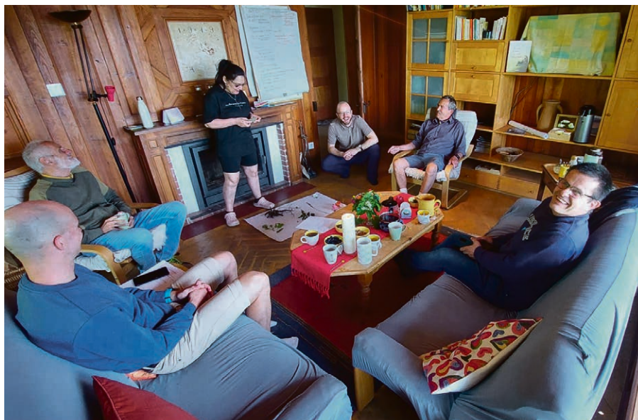
Une partie de l'équipe de préparation des célébrations de la diaconie lors d'une journée de retraite à Corbeyrier le 2 juin dernier.