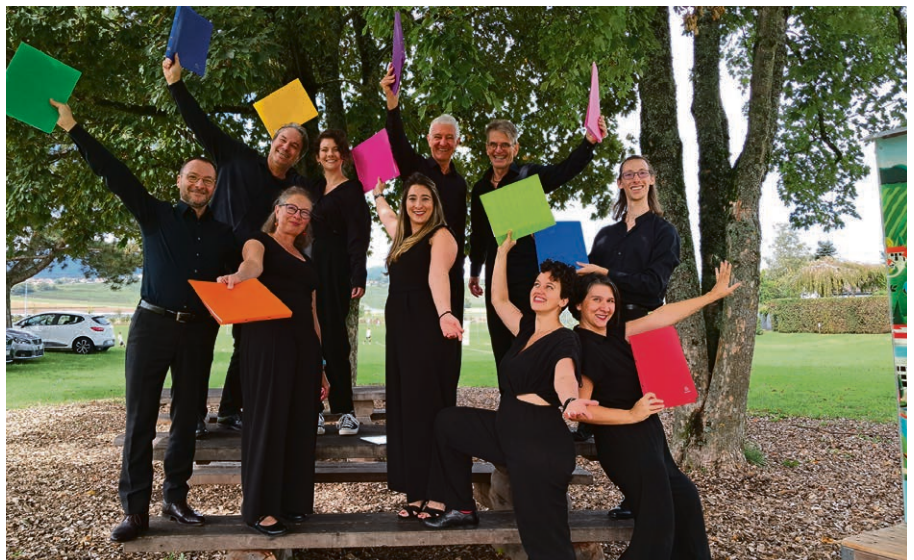
Un voyage musical proposé par l'octuor RANDOM le 23 août prochain.

ECUBLENS – SAINT-SULPICE Mercredi 1 er juillet, 12h-14h. Que ce soit seul ou bien entouré, quel que soit l'âge : tout le monde est invité pour ce repas partagé aux saveurs ouest-africaines ! Le service a lieu entre 12h et 13h. Le prix libre permet à chacun de participer selon ses moyens et de défrayer l'équipe de cuisine constituée de personnes en situation administrative fragile, pour la plupart exclues du marché du travail. Pas besoin de s'inscrire, mais si vous êtes sûrs de venir, merci de l'indiquer à la paroisse pour que les quantités soient adéquates : ecublenssaintsulpice@eerv.ch .