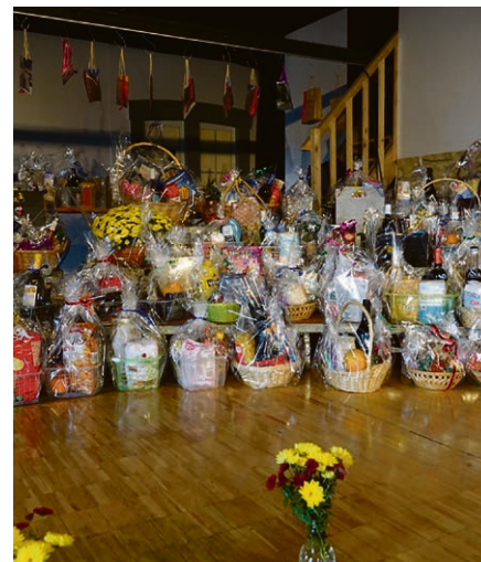
C'était la fête, beaucoup de lots attendaient leurs destinataires!

Le premier week-end de juillet, en soirée, au Centre œcuménique de Cugy, sous la direction de notre musicienne d'Eglise Marjaana Miettinen, la chorale paroissiale féminine s'unira à un groupe de femmes finlandaises, qui viennent chanter en Suisse, pour offrir un répertoire de musique du monde qui vous fera voyager! Avant de partir en vacances, venez les écouter!