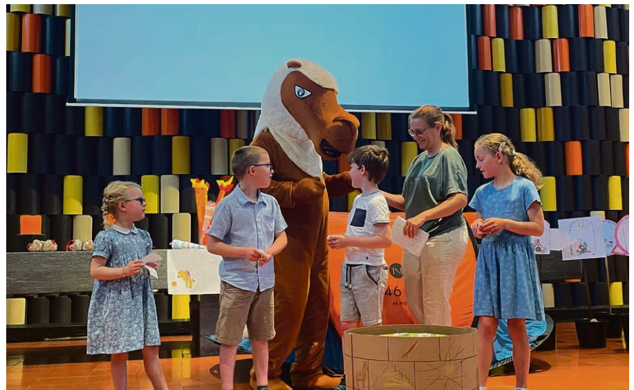
Les P'tits Explorateurs sont venus agrémenter une belle Journée d'offrande.