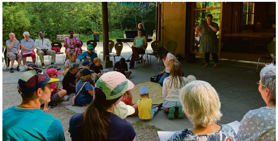
Une belle journée au refuge le 31 mai dernier