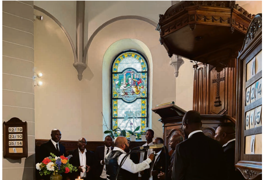
Culte de Pentecôte avec le chœur Cocebai