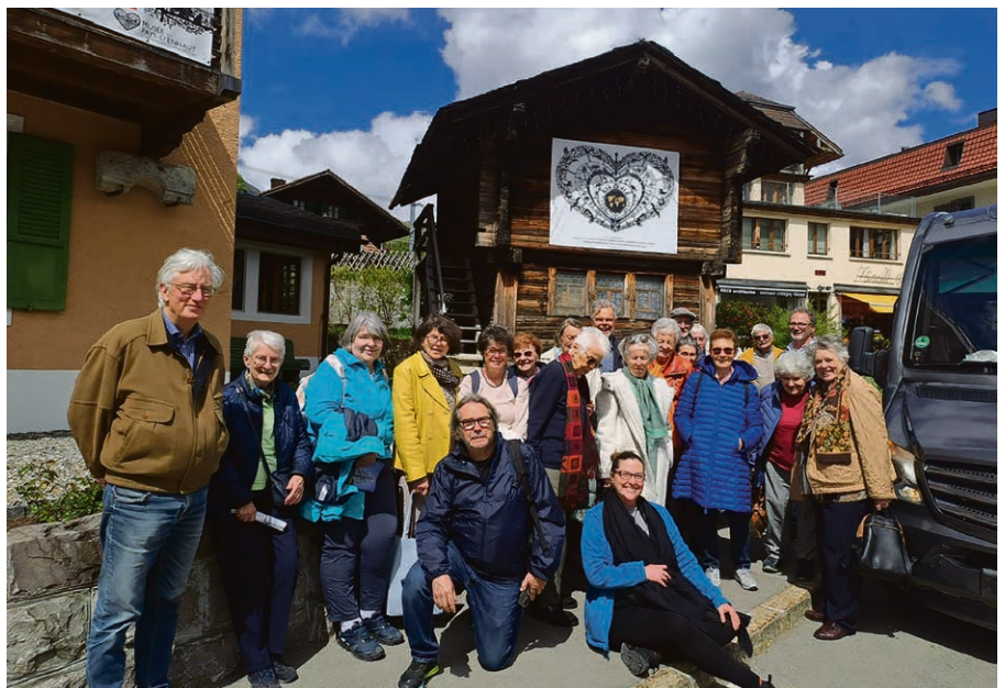
Sortie des 60 ans et plus au Pays-d'Enhaut, 7 mai 2026.