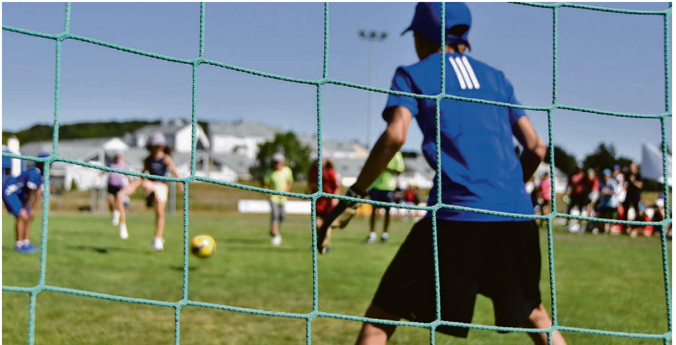
Les KidsGames, cinq jours complètement dingues !

Les KidsGames, ce sont cinq jours de folie, du 3 au 7 août, à Epalinges. Il reste encore quelques places pour les enfants qui souhaitent participer à des activités sportives et des animations favorisant le respect, l'amitié et l'entraide.