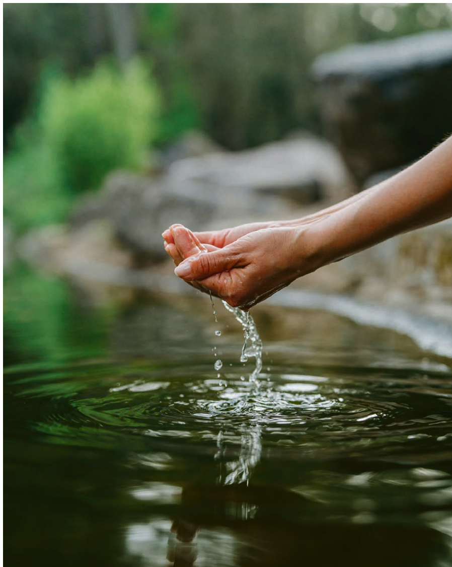
L'Eglise accueille toute personne désirant entreprendre un parcours pouvant mener au baptême.