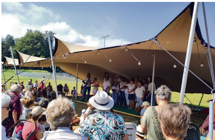
Célébration lors du brunch d'été aux Estivales en 2025.

Infos : www.eerv.ch/lasallaz-lescrosiettes . ▀