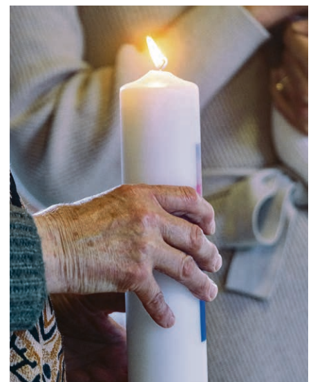
De génération en génération, l'espérance se transmet comme une flamme fragile et précieuse.