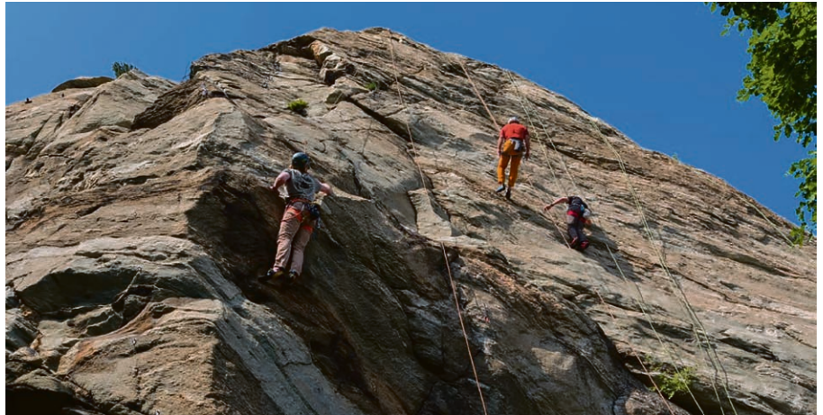
Trois jours pour faire rimer verticalité et spiritualité.