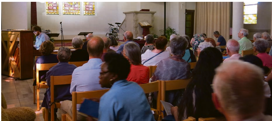
L'église de Bellevaux pleine comme un œuf lors du culte régional de Pentecôte.