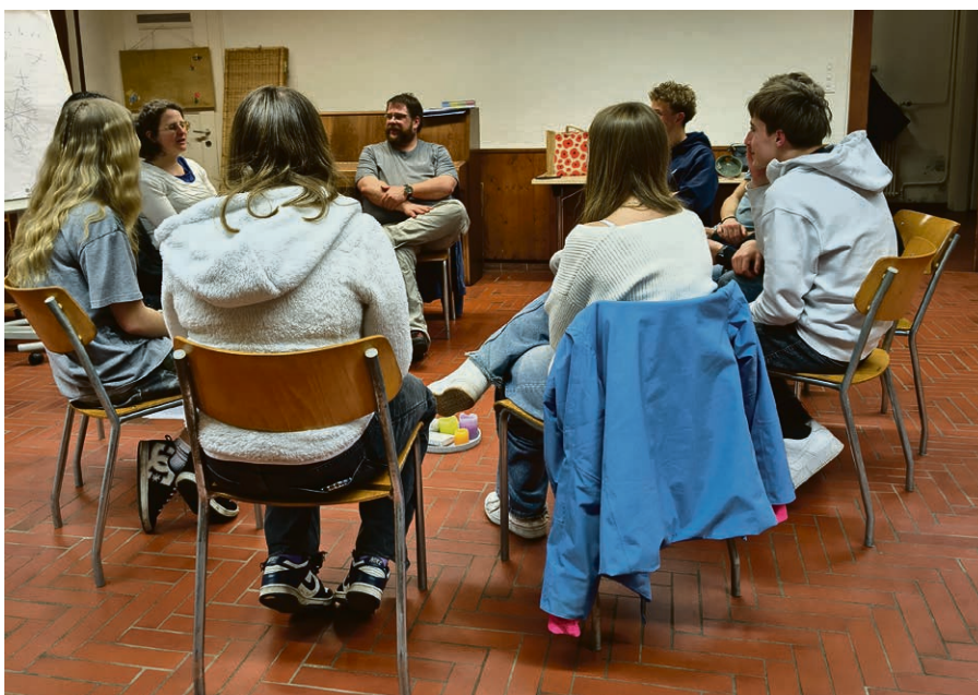
Les rencontres du catéchisme reprennent au mois de septembre. N'hésitez pas à inscrire vos enfants dès maintenant.

Du 2 au 8 août au Puits d'Orbe pour les enfants de 6 à 10 ans. Une semaine d'activités sportives et spirituelles. Contact: orbe@kidsgame.ch – Renseignements: kidsgames.ch .