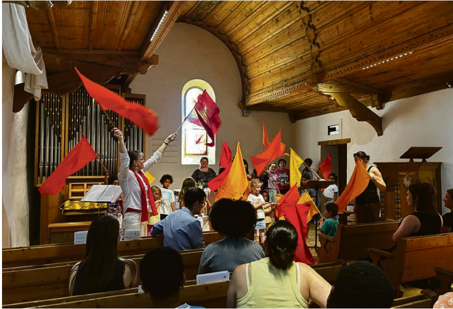
Le culte de Pentecôte lors du week-end familles a été créé par les enfants.