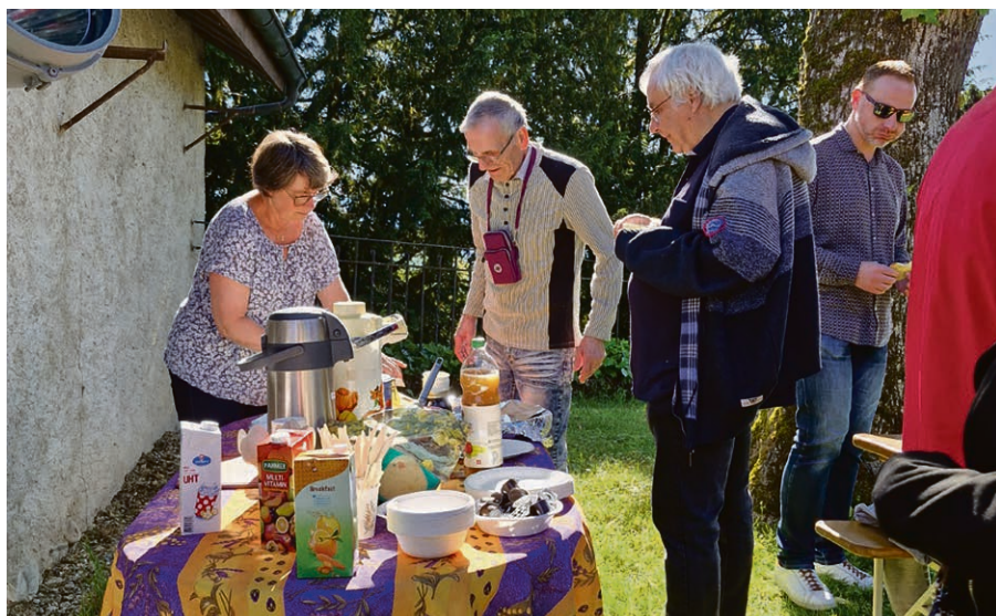
Un petit-déjeuner de Pentecôte ensoleillé dans la paroisse de Ballaigues-Lignerolle-Rances.