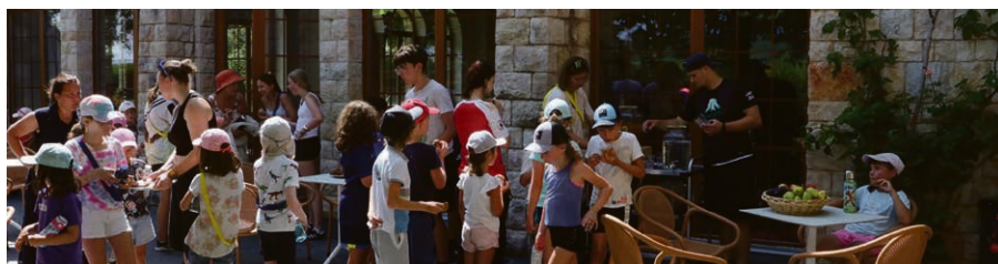
Un camp, c'est aussi l'occasion de se faire plein d'amis!