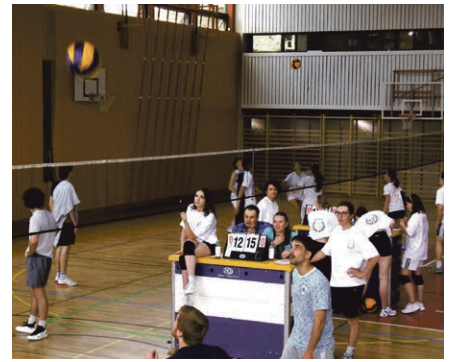
Grand succès pour le premier tournoi de volley des jeunes le 3 mai à Pully.