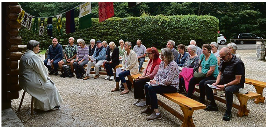
Recueillis pendant le culte patriotique 2025 au refuge des Quatre Croisées à Forel.

auprès de Lise-Marie Biedermann au 079 354 48 47.