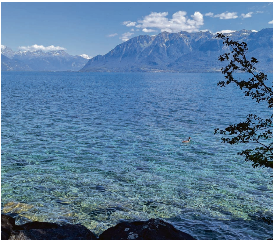
Vue du lac depuis Lavaux.