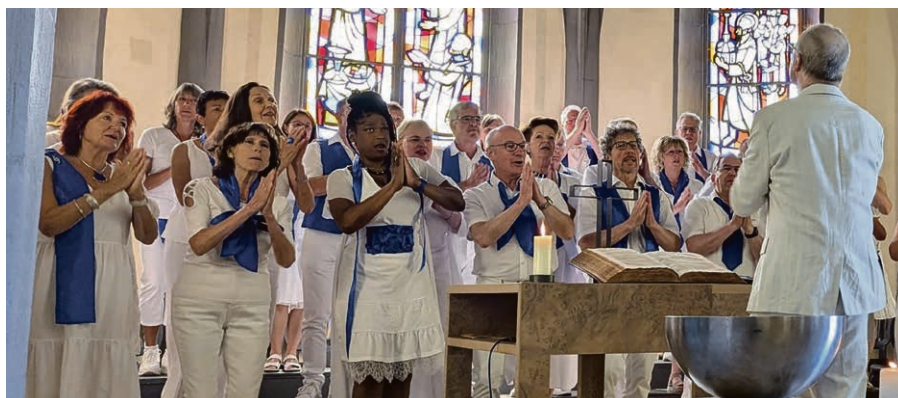
Belle ambiance lors du culte du 15 juin, avec chorale Gospel.

Envie de partager une activité spirituelle