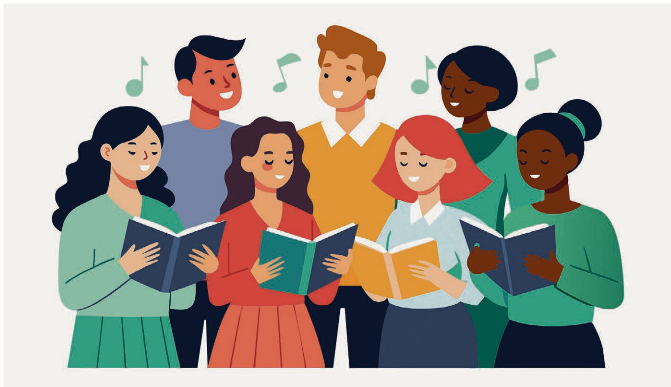
Un atelier pour explorer différentes voix ensemble.

Au programme du 5 septembre: « Laudate omnes gentes » et « El Senyor » (Taizé), « Torrent d'amour et de grâce » et « Saint-Esprit, divin maître » (recueil Alléluia), ainsi que « Come to me » (Iona). Chaque atelier est indépendant. ▀