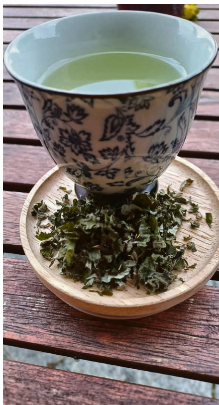
Le thé d'épilobe fermenté.

L'été est la saison où la nature déploie toute sa générosité. Les fleurs offrent leurs dernières gouttes de nectar, les premiers fruits mûrissent et les chemins de montagne se parent de nuances dorées.