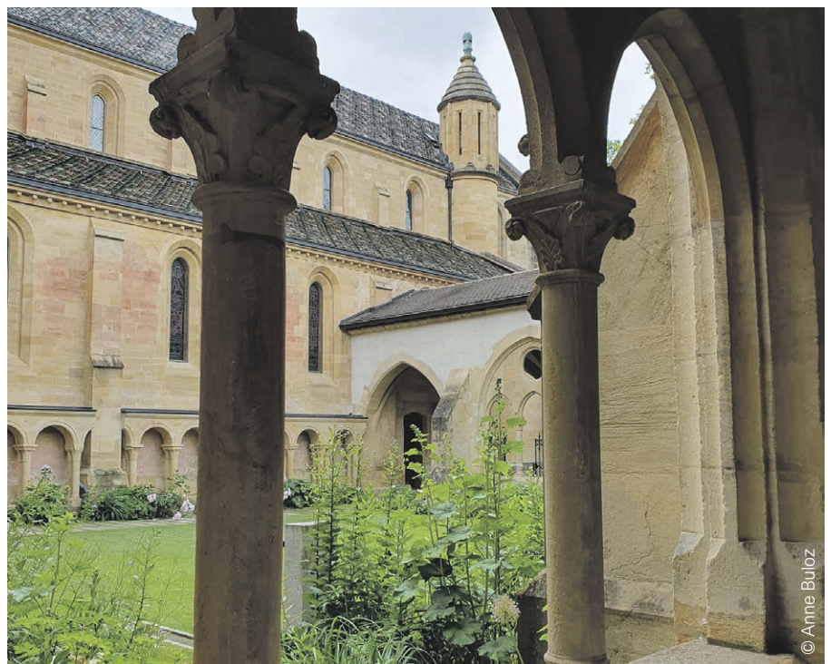
Collégiale de Neuchâtel.

Pour les enfants de la 7 e H à la 10 e H. Informations sur le site internet.