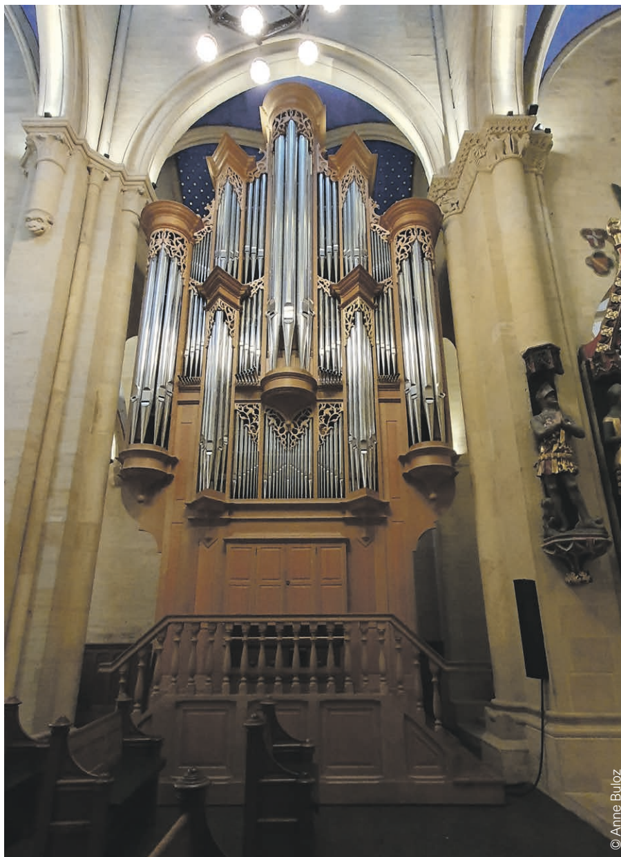
Collégiale de Neuchâtel.

L'Entre-deux-Lacs L'Entre2 – Lieu d'écoute et d'accompagnement spirituel. Vous vivez une période difficile: découragement, deuil, conflit relationnel, problèmes conjugaux... Vous désirez retrouver un sens à votre vie, faire un choix important. Une personne formée est à votre disposition pour vous accompagner. Contact: 079 889 21 90. www.entre2lacs.ch sous Vivre, activités/groupes.▲