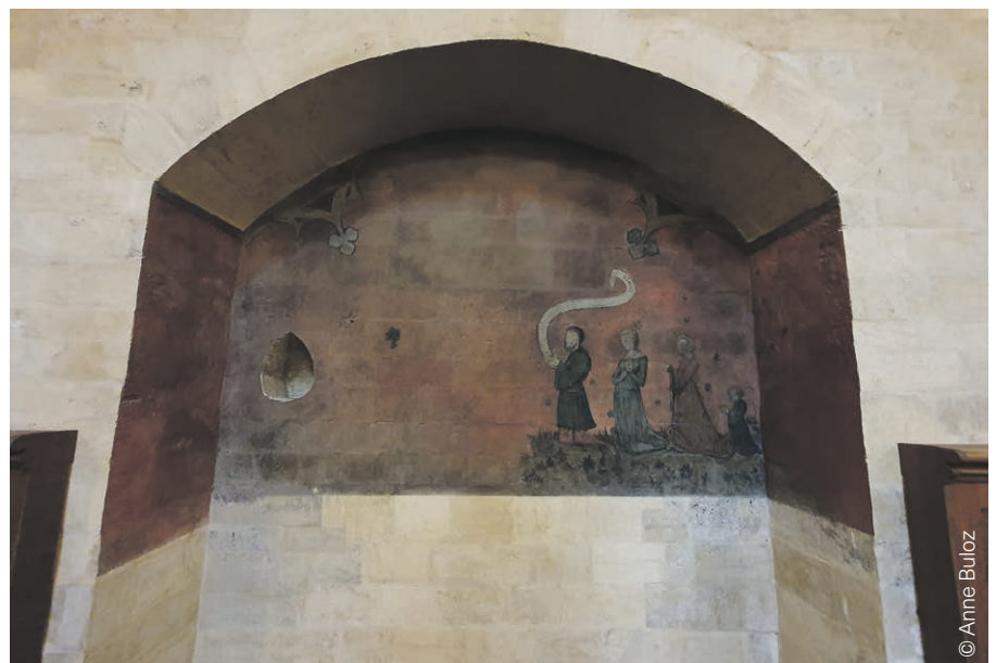
Collégiale de Neuchâtel.

Communauté Don Camillo, Anina Thalmann, Montmirail, 2075 Thielle-Wavre, 032 756 90 00.