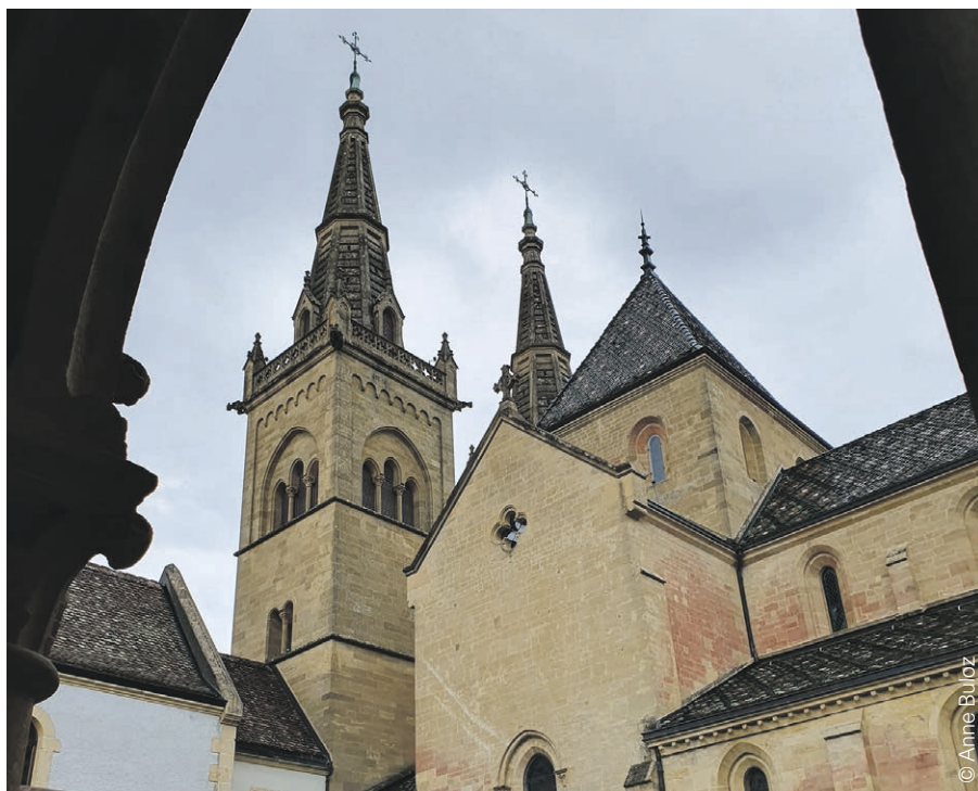
Collégiale de Neuchâtel.

Samedi 19 septembre: « Vivre mieux avec moins », comment se construire un avenir souhaitable, avec Célia Sapart. Plus d'informations: veronique.tschanzanderegg@eren.ch ou 079 311 17 15 et lire en page 27.