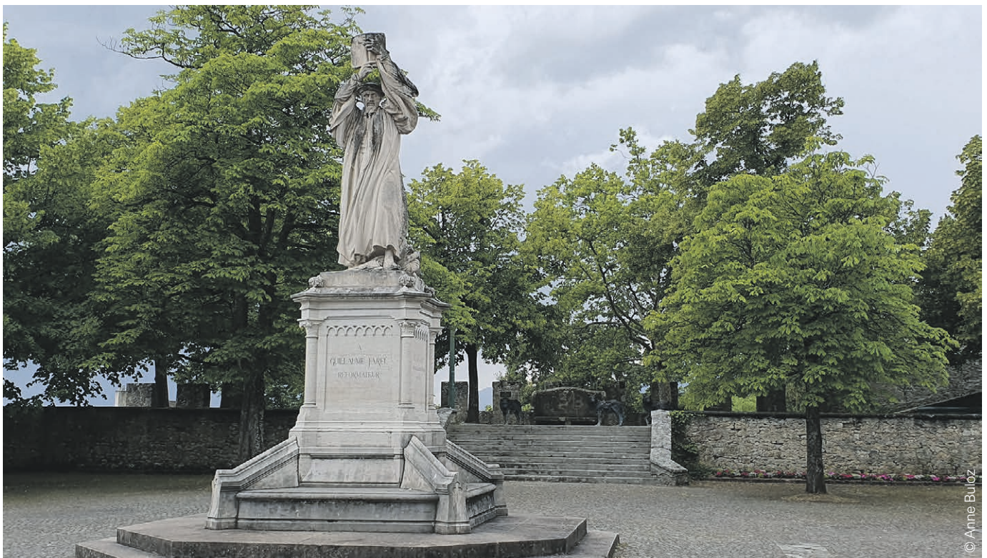
Collégiale de Neuchâtel.